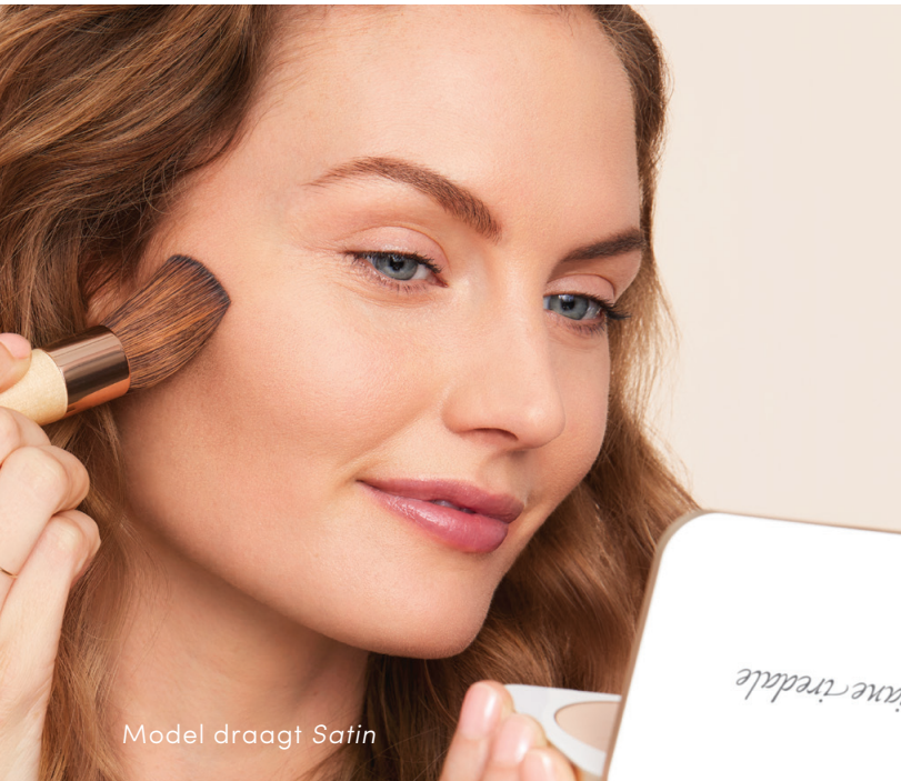
Model draagt Satin