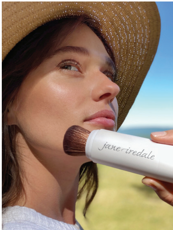
LUXUEUZE, VEGANISTISCHE BORSTEL