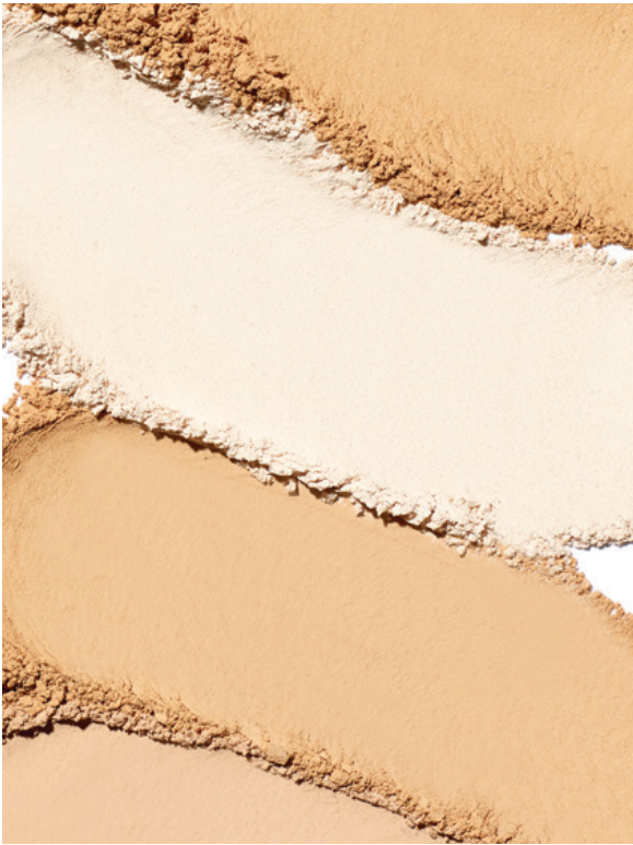
MOEITELOZE APPLICATIE OVER MAKE-UP