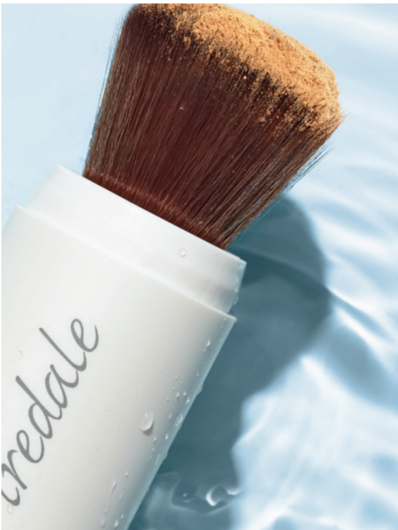
WATER RESISTENT TOT 40 MINUTEN