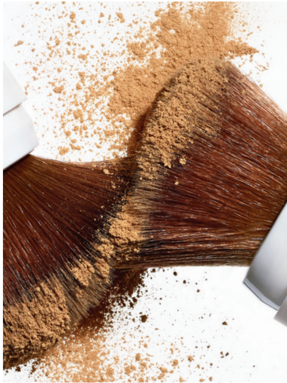
LUCHTIGE POEDER FORMULE